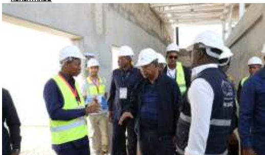
PRESIDENTE DA REPÚBLICA AVALIA OBRAS DO FUTURO HOSPITAL GERAL DO CUANZA-NORTE