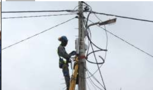
ELECTRIFICAÇÃO DO MUNICÍPIO ALDEIA DE CANGANGA GANHA ENERGIA DA REDE NACIONAL